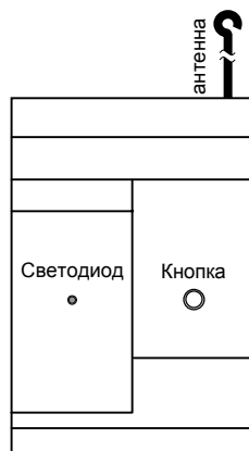
Рис. 1. Внешний вид приемника